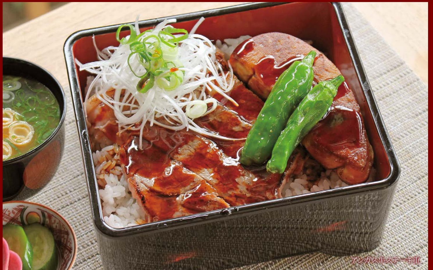
アンガス牛ステーキ重