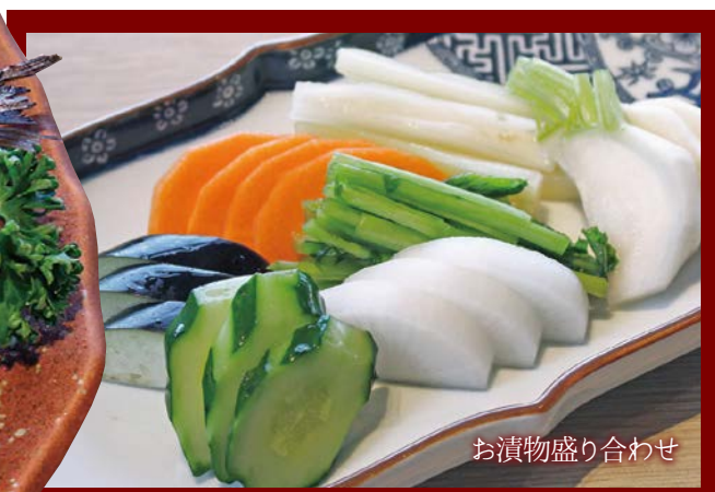
お漬物盛り合わせ