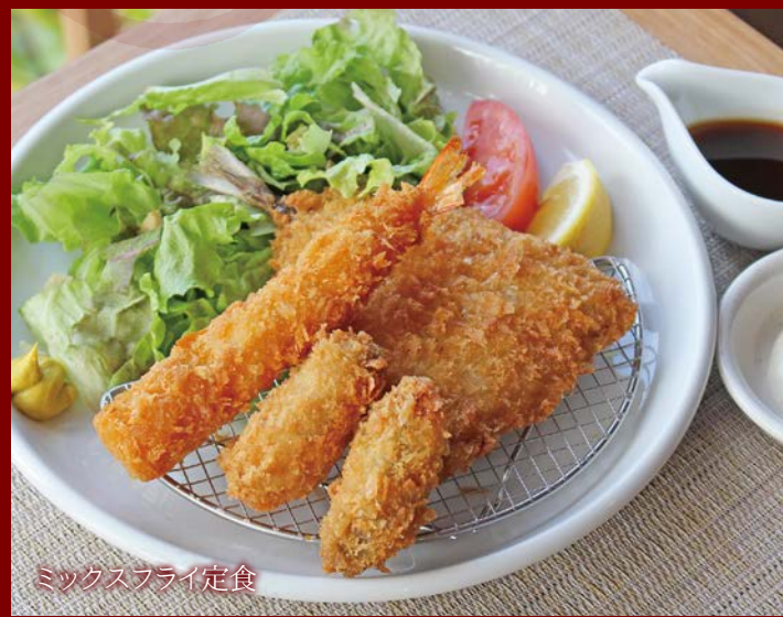
ミックスフライ定食