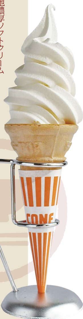
佐倉金子牧場 ソフトクリーム