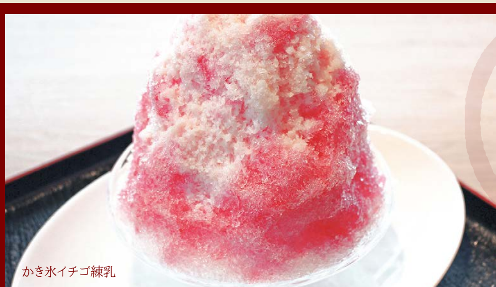
かき氷イチゴ練乳