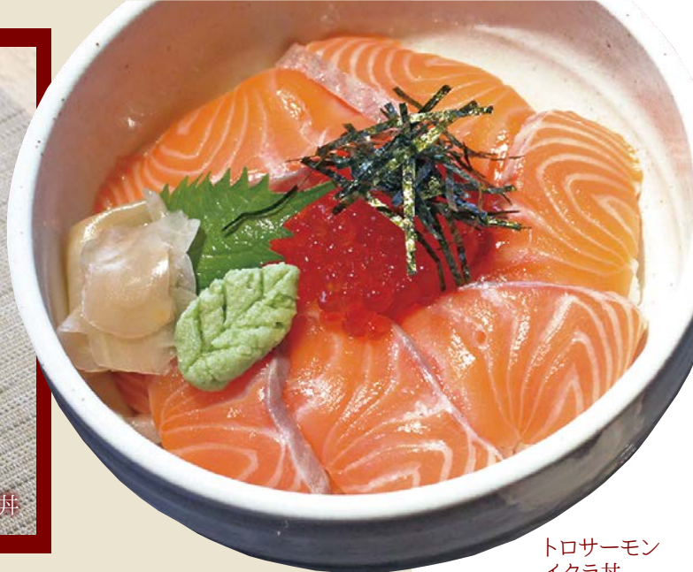
トロサーモン イクラ丼