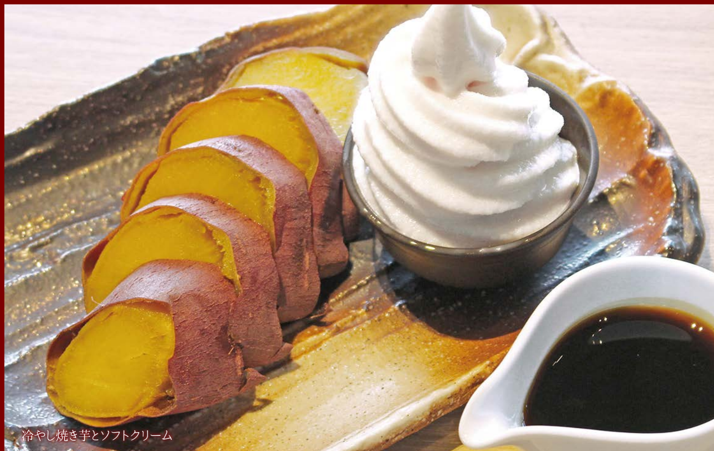
冷やし焼き芋とソフトクリーム