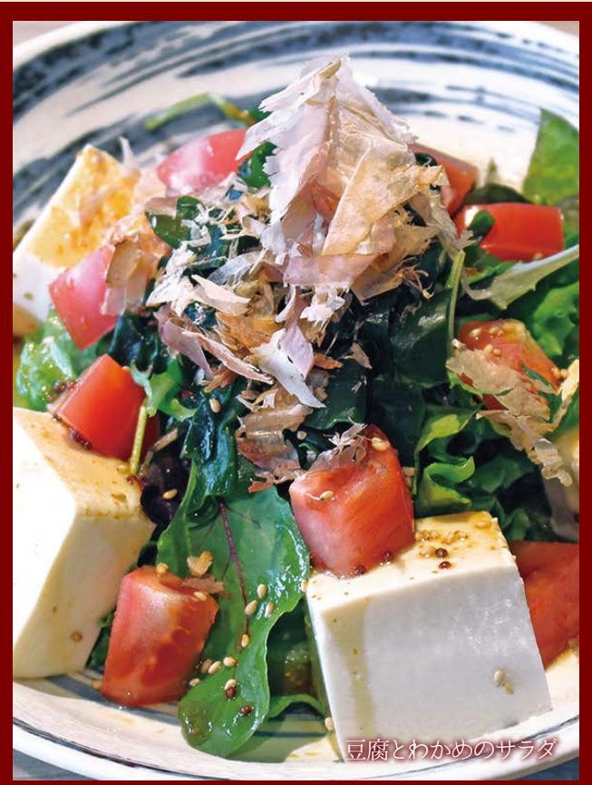
豆腐とわかめのサラダ

※表示価格は税抜き価格です。 ※写真は全てイメージです。 ※食材の都合により内容を変更させていただく場合がございます。