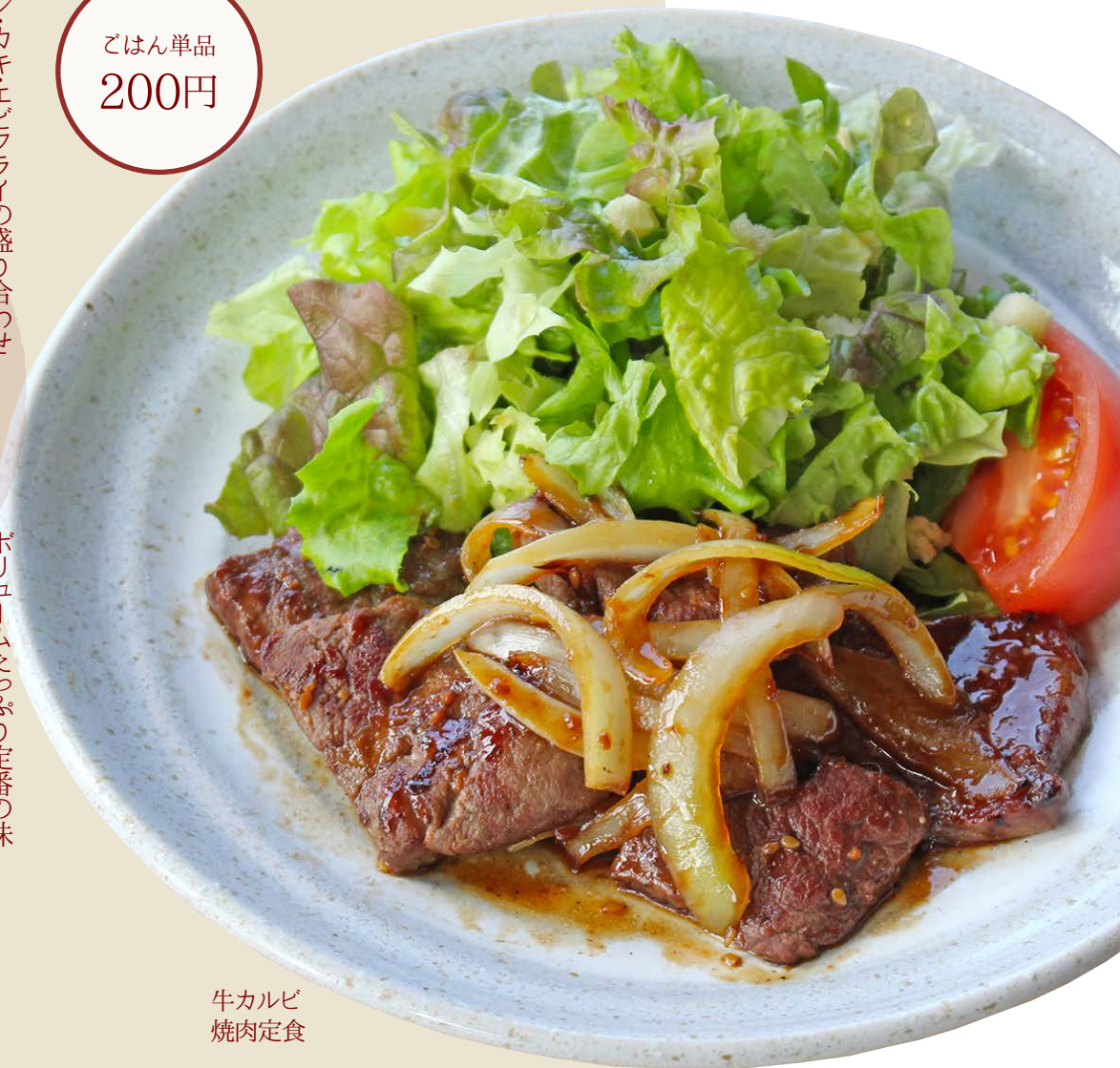
牛カルビ 焼肉定食