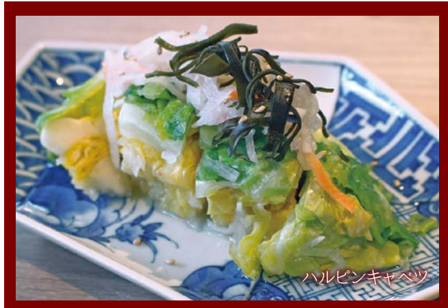
ハルピンキャベツ