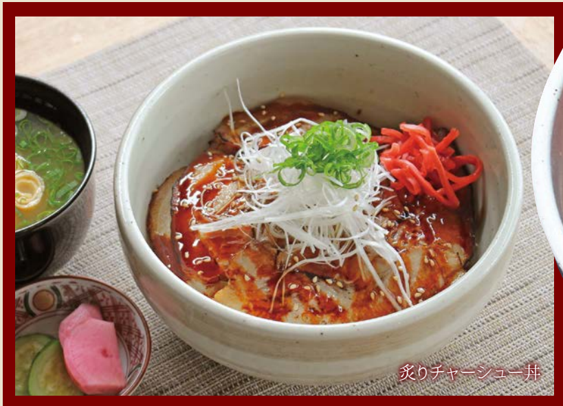
炙りチャーシュー丼