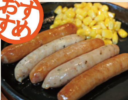
ウインナー盛合せ