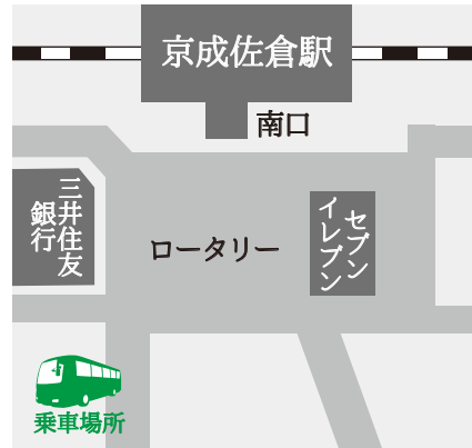
DIC川村記念美術館行きバス乗り場付近