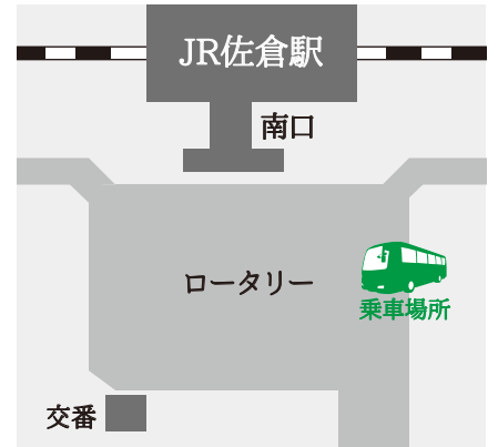
DIC川村記念美術館行きバス乗り場付近